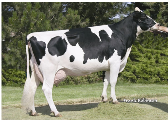
SEAGULL-BAY OMAN MIRROR FIFTH DAM